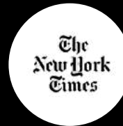
The New York Times