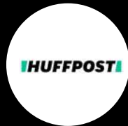
The Huffington Post